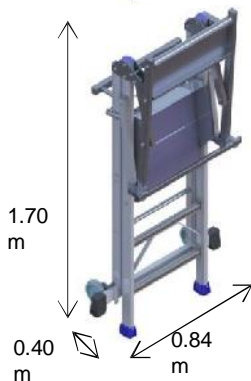
Plate-forme / bordes 500 * 440 mm

Garde-corps rabattable et portillon de sécurité Neerklapbare beugel met rugbescherming