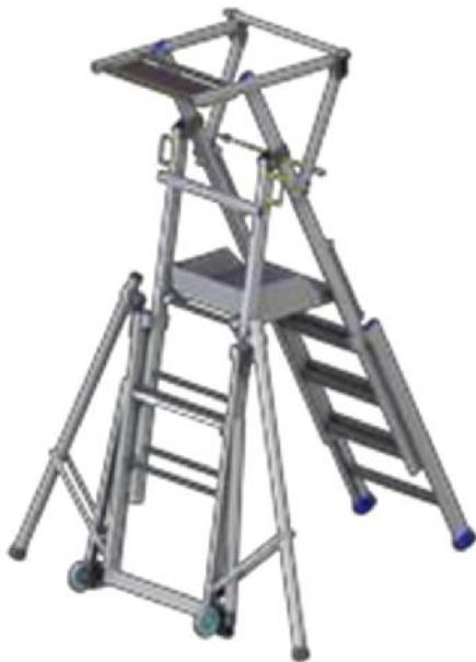
UPIRC 150 SD