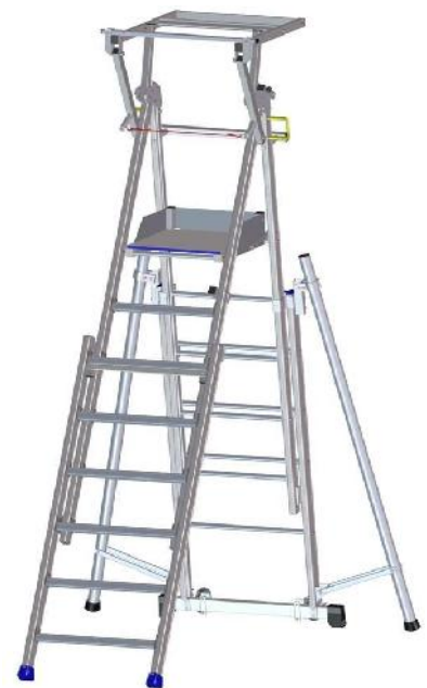
UPIRC 250 SD